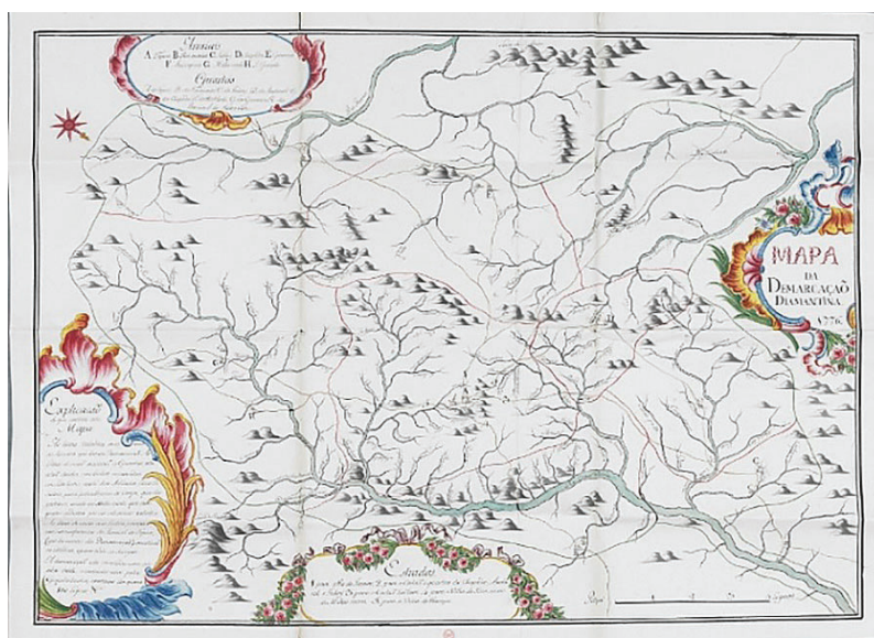
Figura 1. Mapa da demarcação, 1776.

centro da demarcação, estaria simbolizado o Arraial do Tejuco, e ao seu entorno a circunvizinhança da localidade: Rio Manso, Inhaí, Chapada, Gouveia, Milho Verde, São Gonçalo, Rio Pardo, entre outros. Em volta da demarcação, existe um traço contínuo que define os limites, assim como, por meio de estradas e caminhos, mostra as direções para as áreas internas e externas do Distrito demarcado, a saber, para o Rio de Janeiro, para o Sertão e quartéis da Chapada, Andaial e Inhaí, para o Sertão Tão bem, para Vila de Bom Sucesso de Minas Novas e para a Vila do Príncipe, etc.