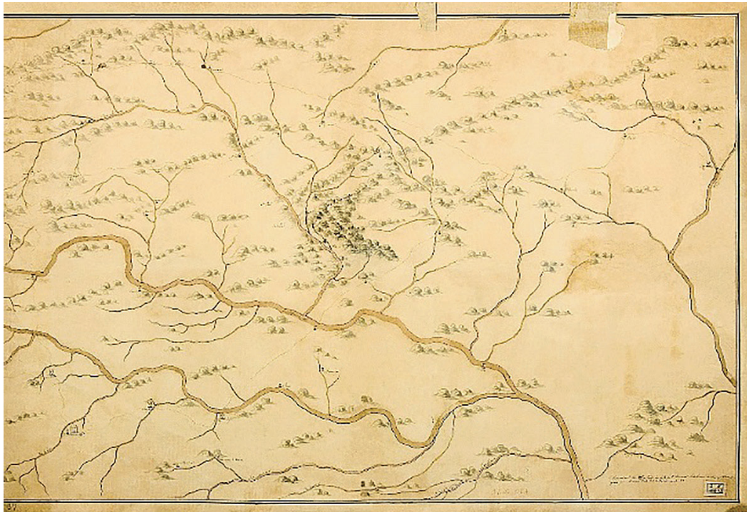
Figura 2. Mapa da demarcação diamantina, 1784. In: Arquivo Público do Distrito Federal . Disponível em: http://www.arpdf.df.gov.br/mapa-da-demarcacao-diamantina/ . Acesso em: 11.05.20.

dicionada ao esforço da governança em promover o abastecimento das áreas mineradoras 21 .