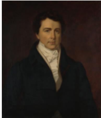
Fig. 1. Unknown artist, Sir Henry Chamberlain , ca. 1810, oil on canvas, 76.8 x 64.3 cm.

received training as a draughtsman at the Royal Naval Academy, “enthusiastically attending the drawing courses that were part of the training for naval officers”, although this is difficult to confirm, and he was attached to the Army rather than the Navy. 9 Around this time, his portrait was painted by an unknown artist [Fig. 2], shortly before he went to Brazil. 10