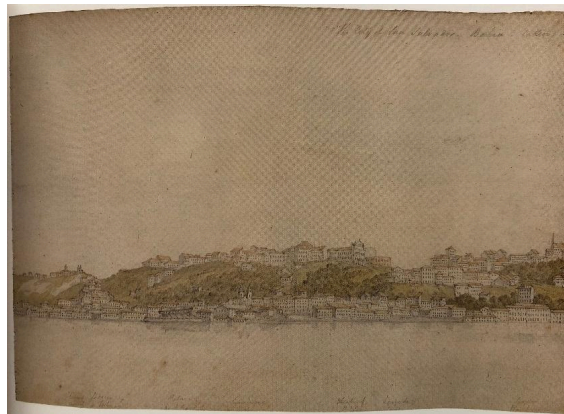
Fig. 9. Henry Chamberlain, The City of San Salvador, Bahia, taken in May 1822 from the Nocton Packet , 1822, watercolour, 21.8 x 99 cm, private collection.