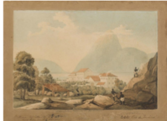
Fig. 4. Henry Chamberlain, The Chamberlains' house in Catete, with the Sugarloaf , ca. 1819–20, watercolour, 19.7 x 26.7 cm.