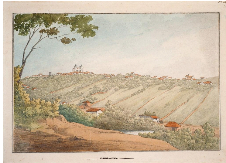
Fig. 12. Henry Chamberlain, Barbacena , ca. 1819–23, watercolour, 19 x 27.5 cm.