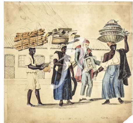
Fig. 8. Henry Chamberlain, Largo da Glória , ca. 1820–21, watercolour.