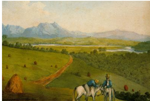
Fig. 10. Henry Chamberlain, View near São Paulo , ca. 1822–3, watercolour, 18.8 x 26.9 cm, collection of Ney Castro Alves, São Paulo