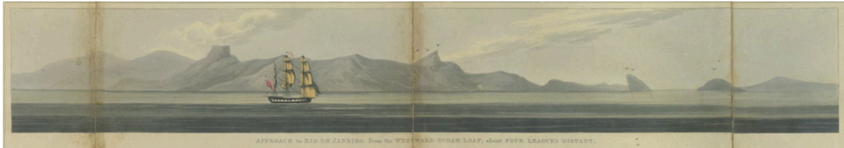
Fig. 6. John Clark after Henry Chamberlain, Approach to Rio de Janeiro, from the Westward Sugar Loaf, about four leagues distant , published 1821, coloured aquatint.