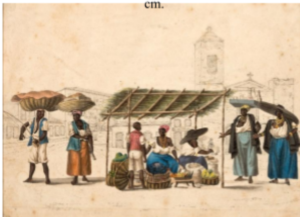
Fig. 7. Henry Chamberlain, Quitandeiras da Lapa (Study for “A Market Stall”) , ca. 1820–21, watercolour, 21 x 28 cm.

Lastly, Ferrez catalogued the original watercolour for the print The Palace (signed “H. Chamberlain”), but its present whereabouts are unknown. 32 Two other watercolours (one of them signed) which may have served for the prints Braganza and Boa Viagem , and which also came from the Chamberlain family, are also unaccounted for. 33