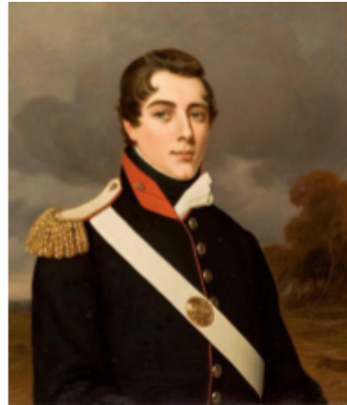
Fig. 2. Unknown artist, Lt. Henry Chamberlain , ca. 1819, oil on canvas, 76.5 x 64 cm.