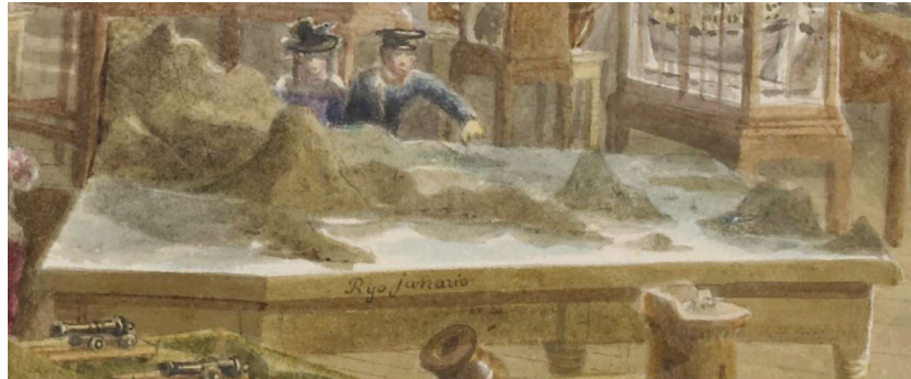
Fig. 16. Detail of Fig. 15, showing the topographical model of Rio de Janeiro by Lt. Henry Chamberlain

and weapons were on display. A copy of the Views and Costumes was also donated to the regiment's library, presumably by Chamberlain, but it is no longer in the collection. 56