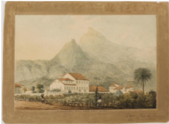
Fig. 3. Henry Chamberlain, The Chamberlains' house in Catete, with the Corcovado , ca. 1819–20, watercolour, 19.8 x 27.3 cm.